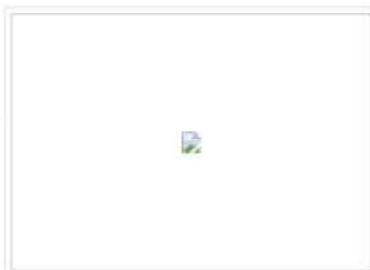
Silvia Valesini, "La caravana", óleo.