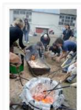
Jornada de quemas alternativas | Patio FBA