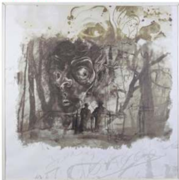
"De pasajes tacturnos y algo más", de Díaz Lilien Irene, estará en la muestra el viernes 26 de octubre.

En la Galería Pisouno Artediseño, se realizará el viernes 26 de octubre a las 18.30, la presentación del Catálogo 2012 de la itinerancia "0221-La Plata se Muestra"- 6ª edición. Se llevará a cabo en el Salón principal de Pisouno, ubicado en Diagonal 73 N° 1352 entre 58 y 59.