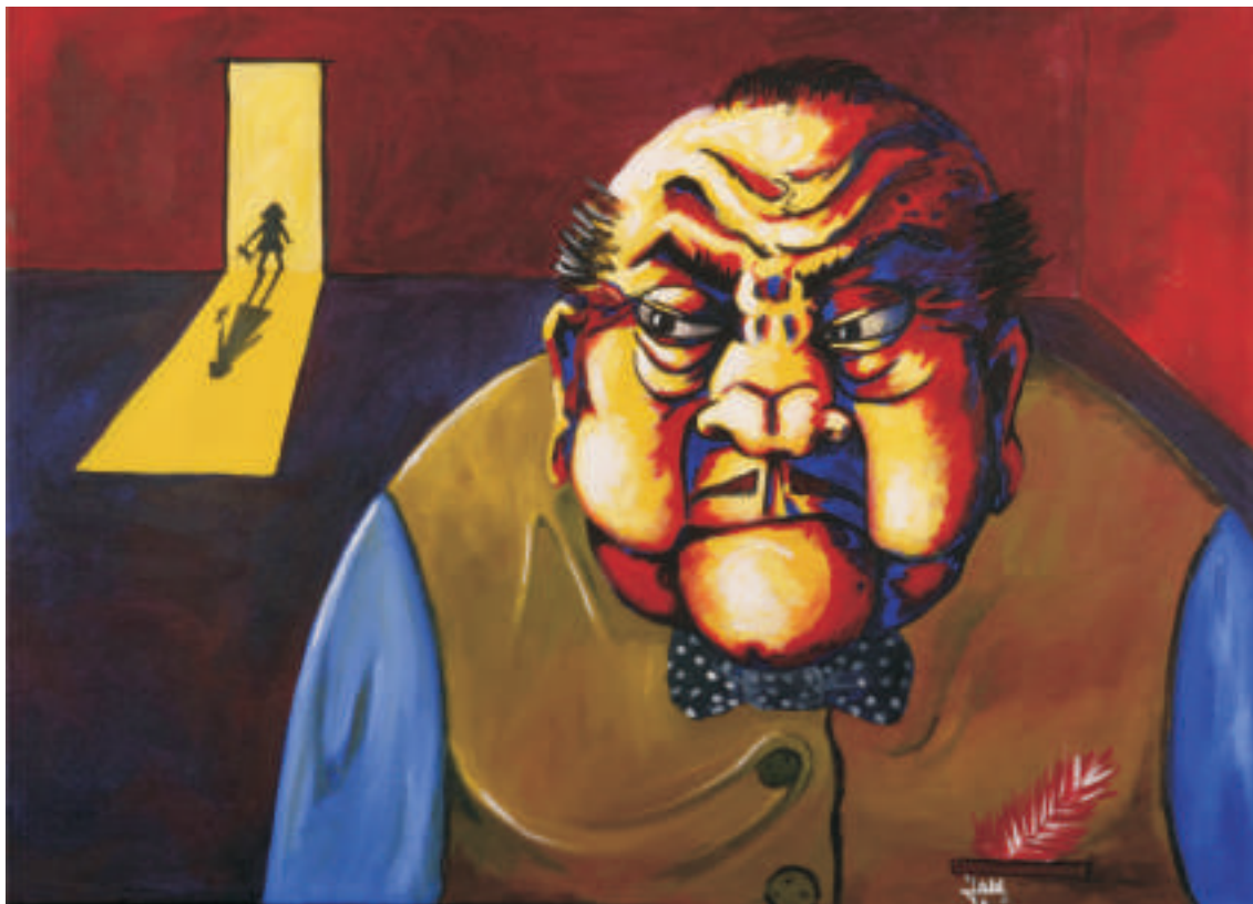
Juan Jalil | Chango | Acrílico sobre tela | 0,50 x 0,70 m | 2011