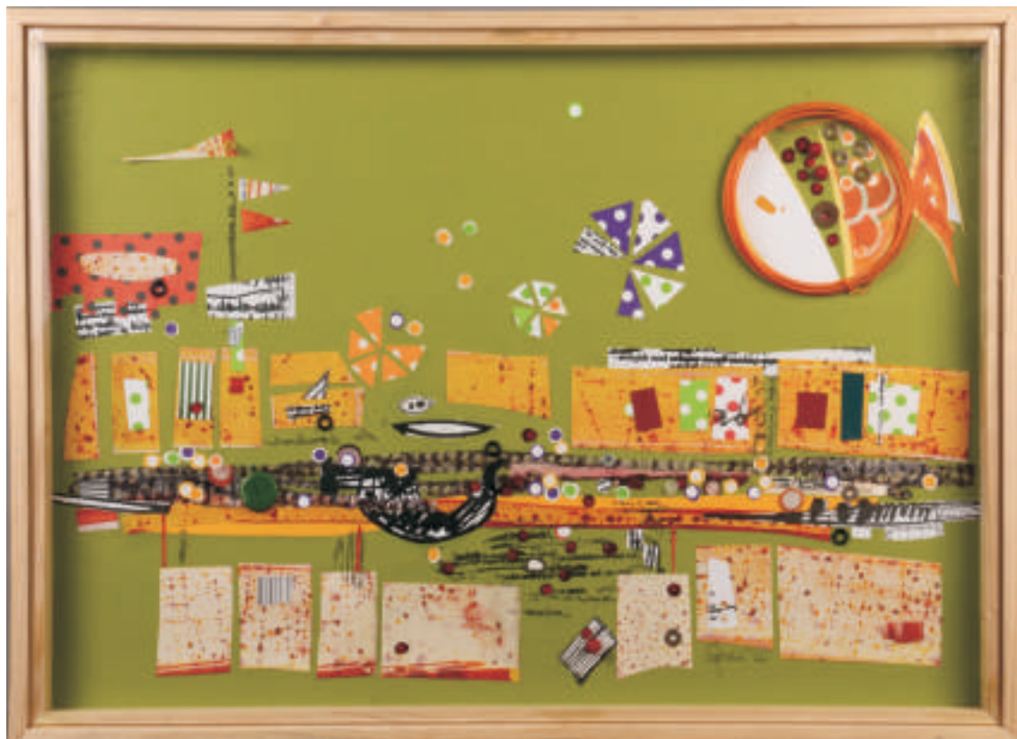
Silvina Valesini | La caravana | Técnica mixta | 0,50 x 0,70 m | 2011