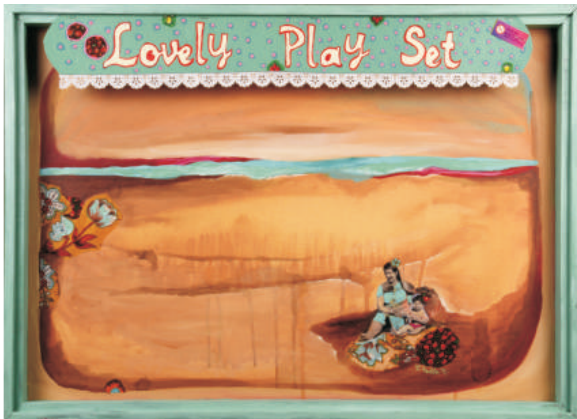
Verónica Fadon | El mar | Técnica mixta | 0,50 x 0,70 m | 2011