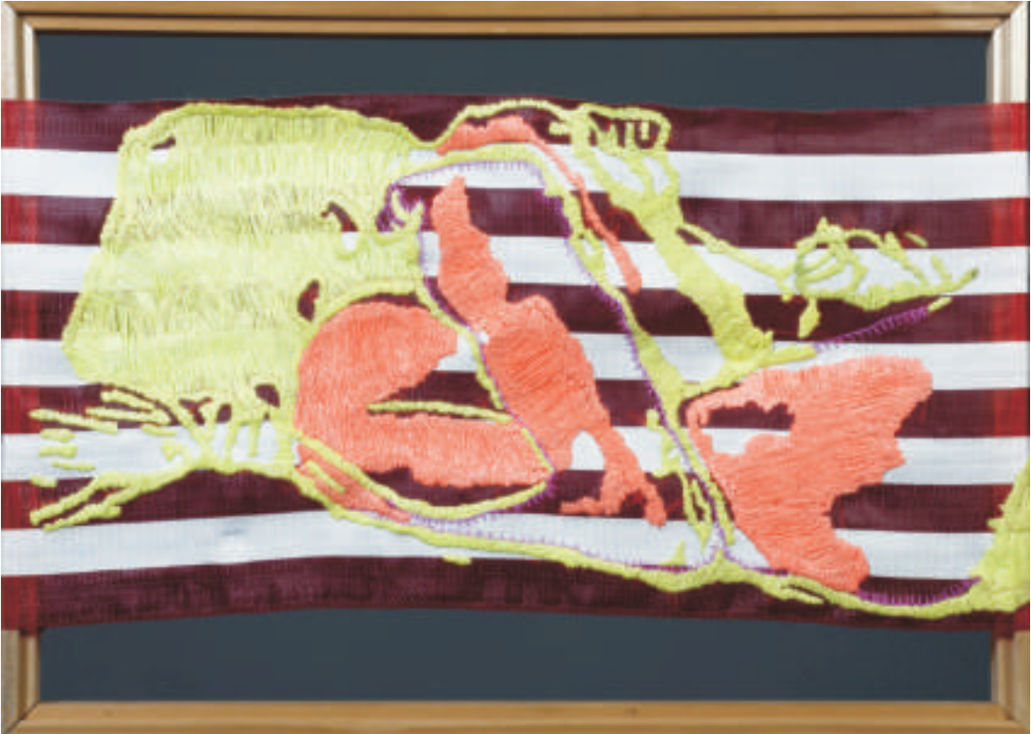
Rocío Navarro | Reposados | Técnica mixta | 0,50 x 0,70 m | 2011