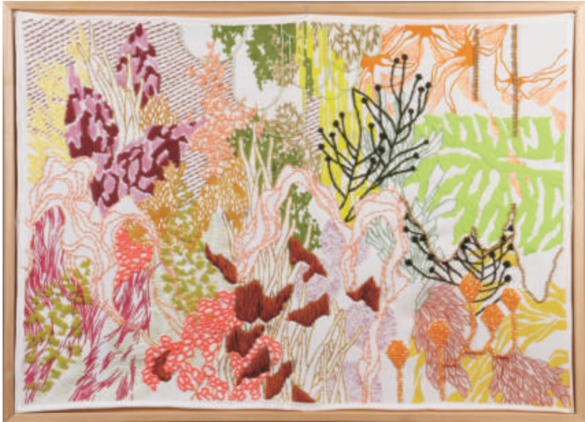
Rosario Salgado | La selva mi disfraz | Técnica mixta sobre textil | 0,50 x 0,70 m | 2011