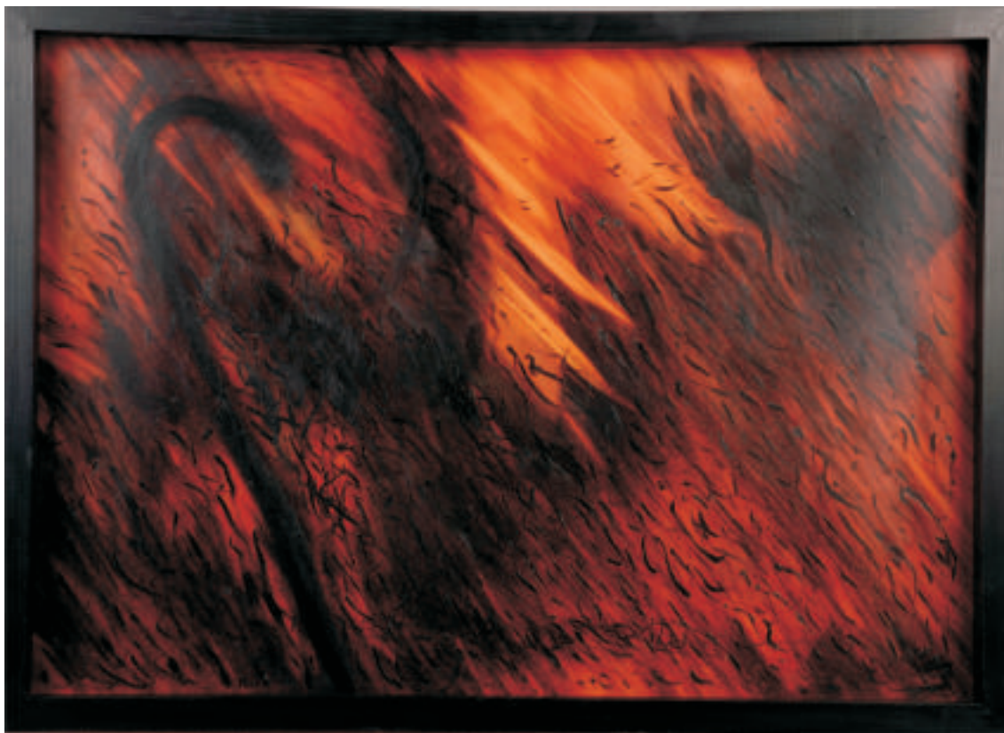
Elizabeth Simeone | No-es | Impresión digital intervenida | 0,50 x 0,70 m | 2011