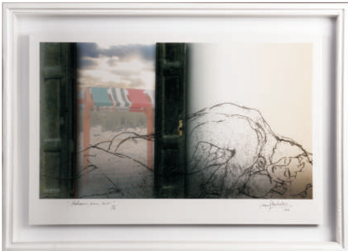
Graciela Grillo | Balnearios, arena, amor | Collage Digital | 0,50 x 0,70 m | 2011