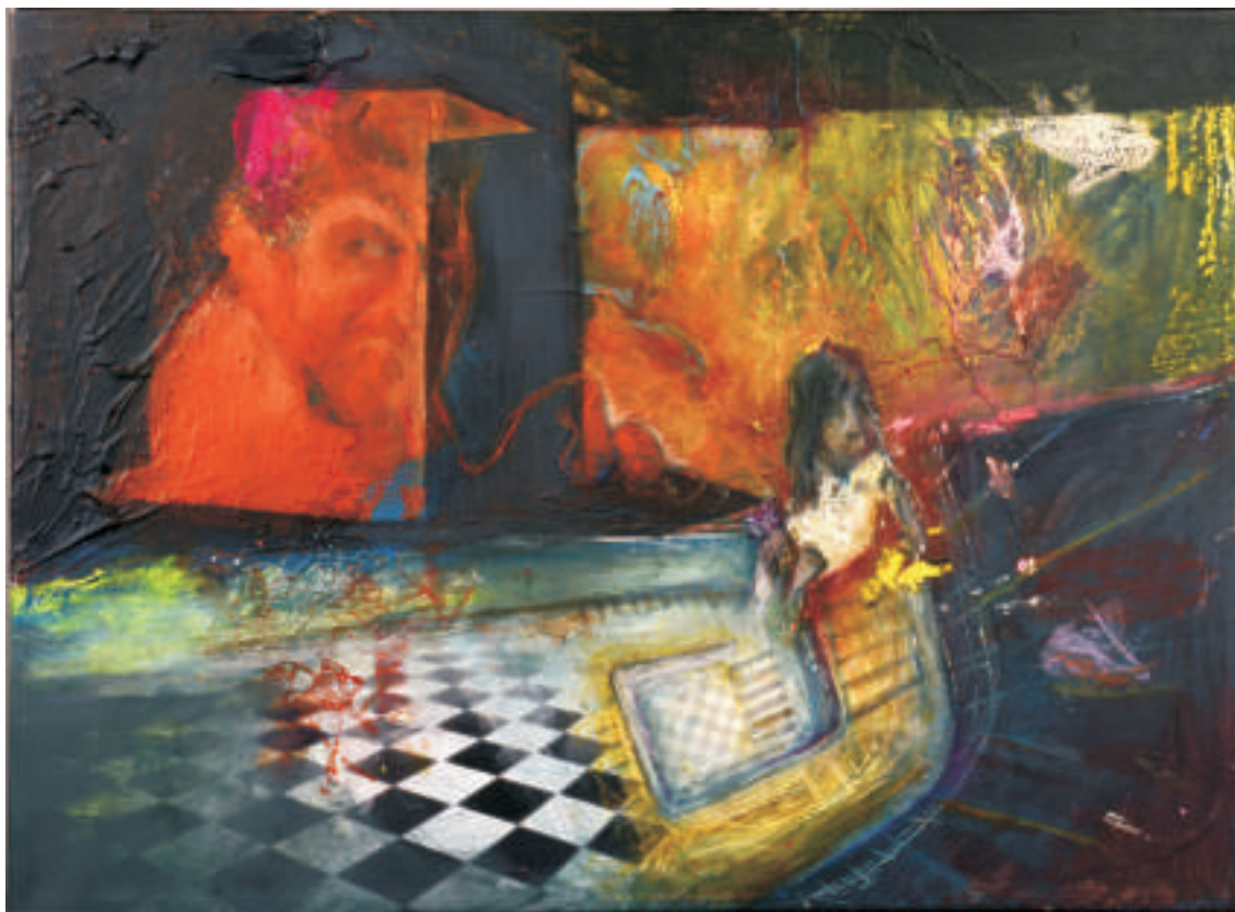
Fernando Bisignani | Lustrina azul | Técnica mixta | 0,50 x 0,70 m | 2011