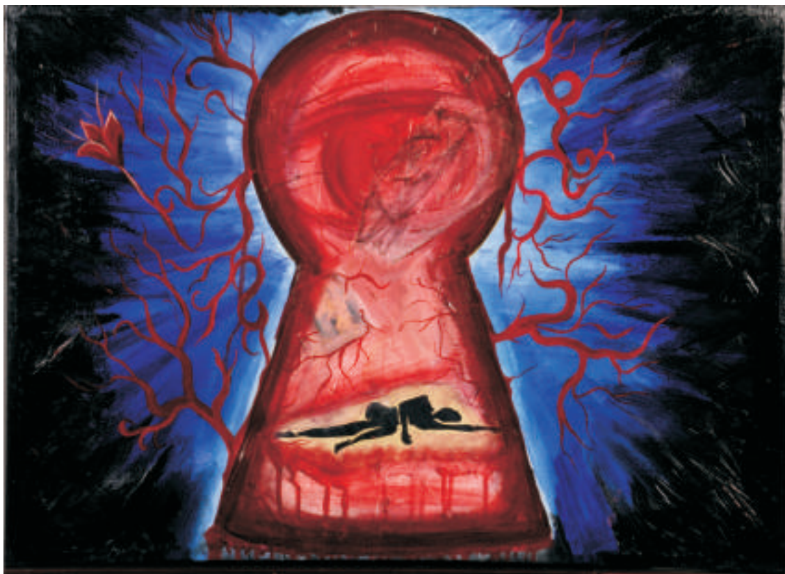
María Laura Varveri | Lo horrible imita lo hermoso | Óleo | 0,50 x 0,70 m | 2011