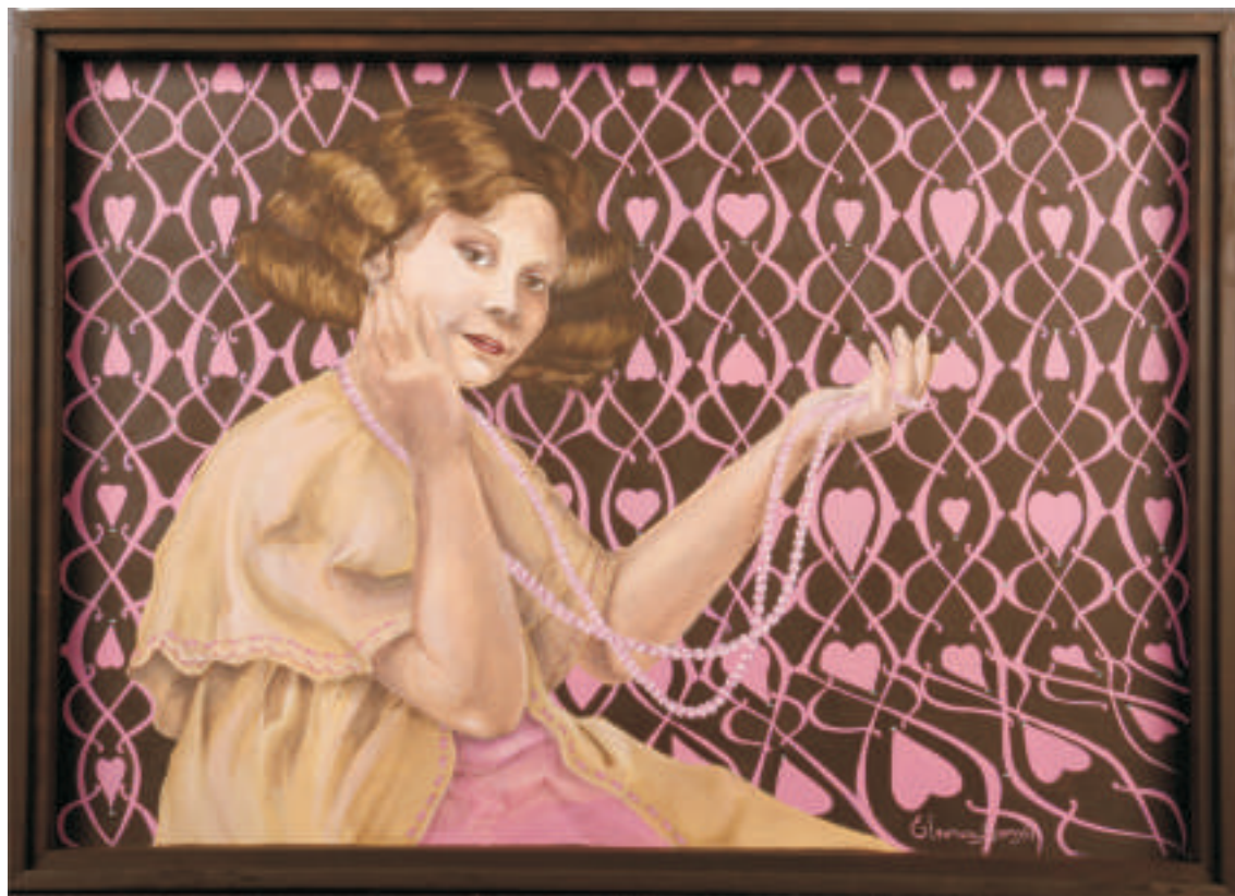
Eleonora Burry | El amor | Técnica mixta | 0,50 x 0,70 m | 2011