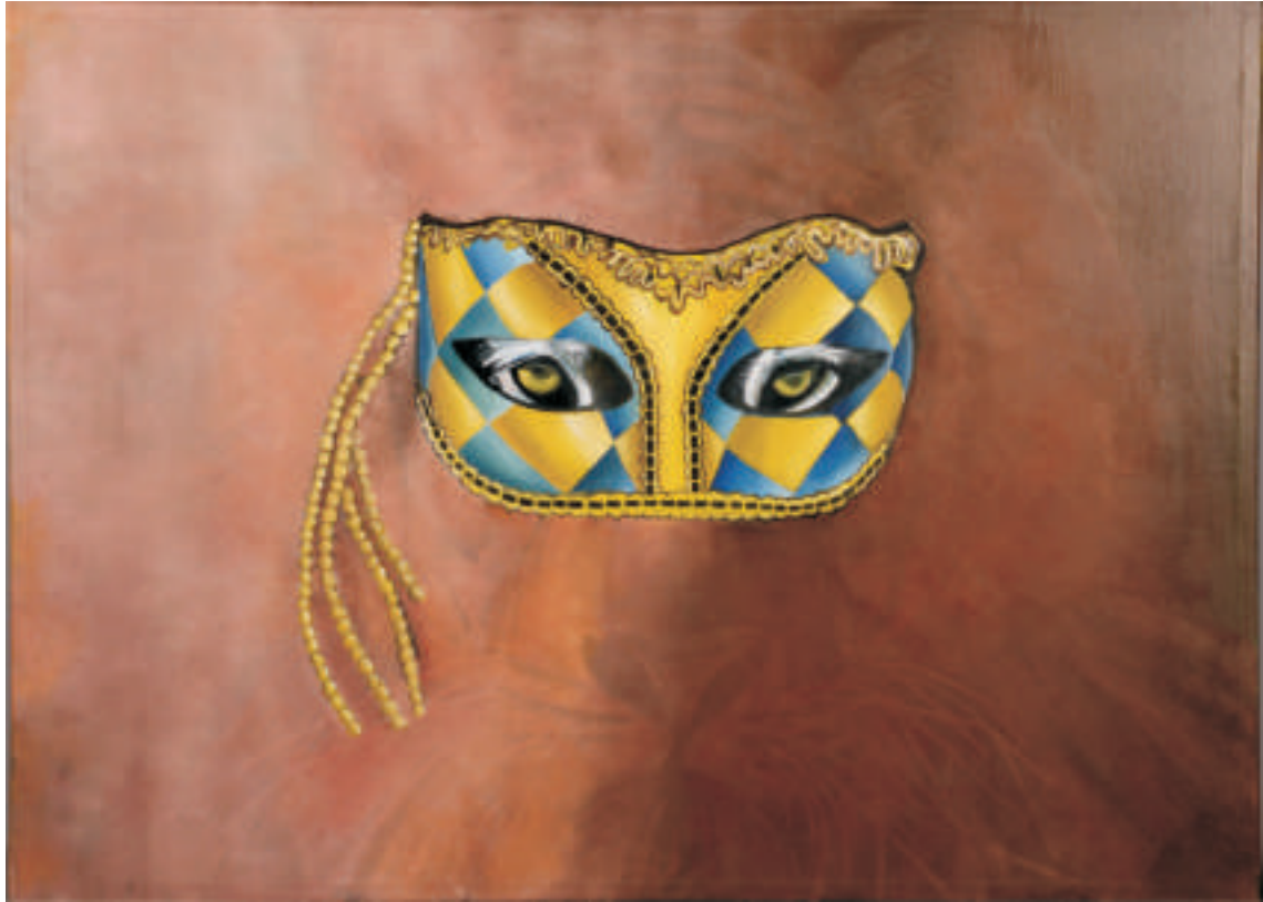
Ursula Balbuena | El amor | Óleo sobre tela | 0,50 x 0,70 m | 2011