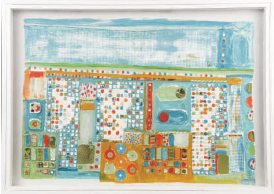
Cecilia Codoni | Desde la ventana | Collagraph | 0,50 x 0,70 m | 2011