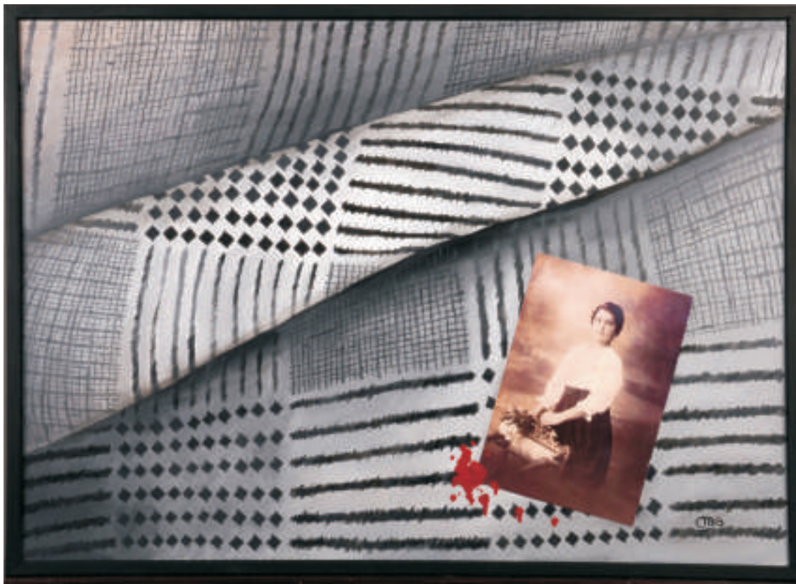
Marcela Inés Gonzáles | El amor duele | Técnica mixta | 0,50 x 0,70 m | 2011